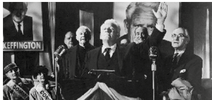
The Last Hurrah John Ford Stati Uniti, 1958 Cast S. Tracy, J. Hunter, D. Foster, P. O'Brien

Tra i più grandi registi della storia del cinema. Per la storia de L'ultimo urrà! ha tratto ispirazione dalla vita del sindaco di Boston James M. Curley, dandogli le fattezze di Spencer Tracy.