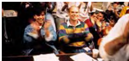
The War Room D. A. Pennebaker, Chris Hegedus Stati Uniti, 1993, 96'

Coppia artistica e nella vita, Chris Hegedus e D.A. Pennebaker sono conosciuti per il loro stile incisivo di cinema verità. Tra i più importanti documentaristi americani, raccontano la campagna di Bill Clinton durante le elezioni presidenziali del 1992.