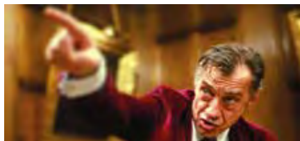
Secret Honor Robert Altman Stati Uniti, 1984, 90' Cast Philip Baker Hall

I suoi film raccontano un'America 'amara', segnata da un senso di nostalgia e animata da una critica disincantata. Altman, immagina un lungo monologo immaginario di Nixon giunto a fine carriera.